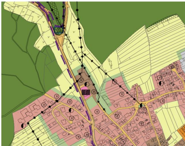
Auszug aus der rechtswirksamen 1. Fortschreibung Flächennutzungsplan mit seinen Änderungsverfahren