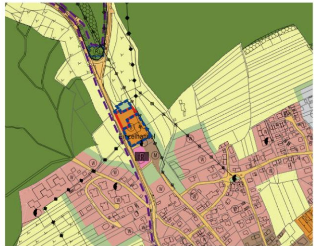
Auszug aus 5. Änderung der 1. Fortschreibung des Flächennutzungsplanes, Vorentwurf vom xx.xx.xxxx Änderung der Nutzung (blau) und Neudarstellung (rot)

Abbildung 1: Gegenüberstellung Auszug rechtswirksamer Flächennutzungsplan und Auszug aus 5. Änderung der 1. Fortschreibung des Flächennutzungsplanes, Vorentwurf vom 13.11.2025, Änderung der Nutzung (blau) und Neudarstellung (rot)